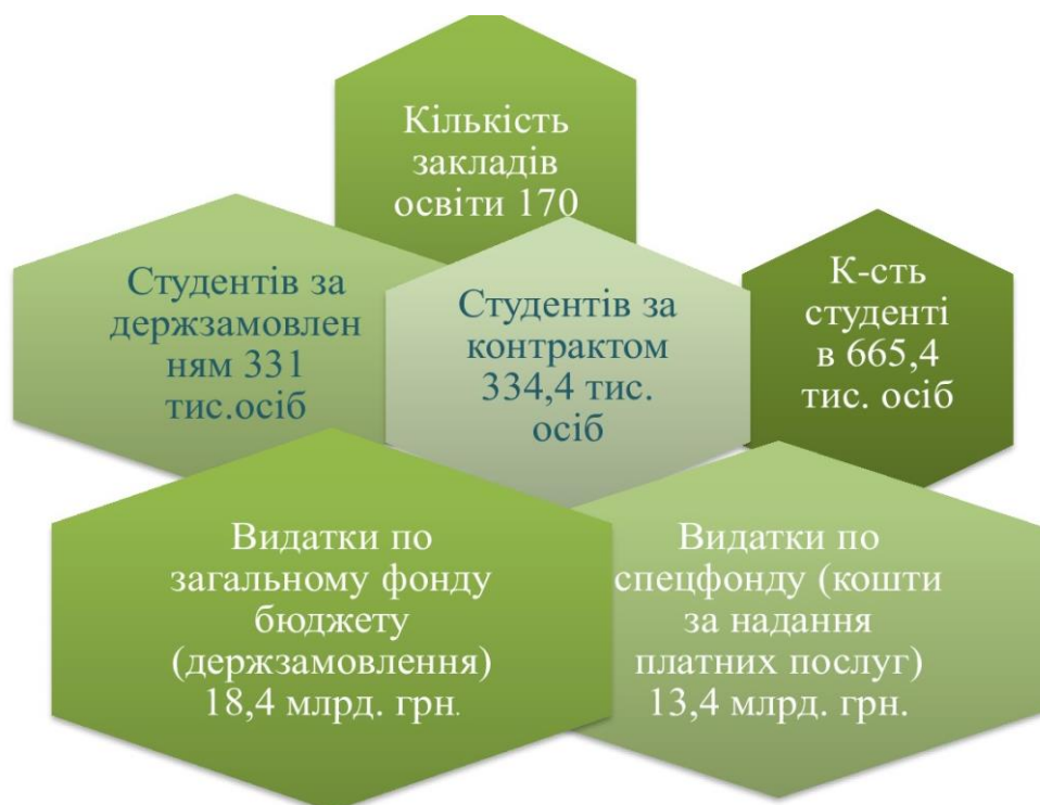
Рис. 2. Функціонування у 2019 році закладів вищої освіти III-IV рівнів акредитації

Аналізуючи дані щодо видатків на вищу освіту, можна зробити висновок, що кількість закладів вищої освіти зменшилась на 4, а кількість студентів зменшилась на 29,7 тис. осіб, студентів за держзамовленням – зменшилась на 4 тис. осіб, студентів - контрактників – зменшилась на 5,4 тис. осіб, видатків по загальному фонду бюджету – збільшилась на 0,9 млрд. грн., видатки по спецфонду бюджету – зменшилась на 1 млрд. грн. Це свідчить про тенденцію зменшення кількості учбових закладів, зменшення кількості студентів за рахунок збільшення оплати навчання в учбових закладах, за рахунок міграції, що спричинена військовими діями. Глобалізація та неперервна інформаційна змінність обумовлюють включення людини в дуже складну систему суспільних взаємовідносин, вимагають від неї готовності щодо нестандартних швидких рішень, прийняття цих рішень і нести за них відповідальність.