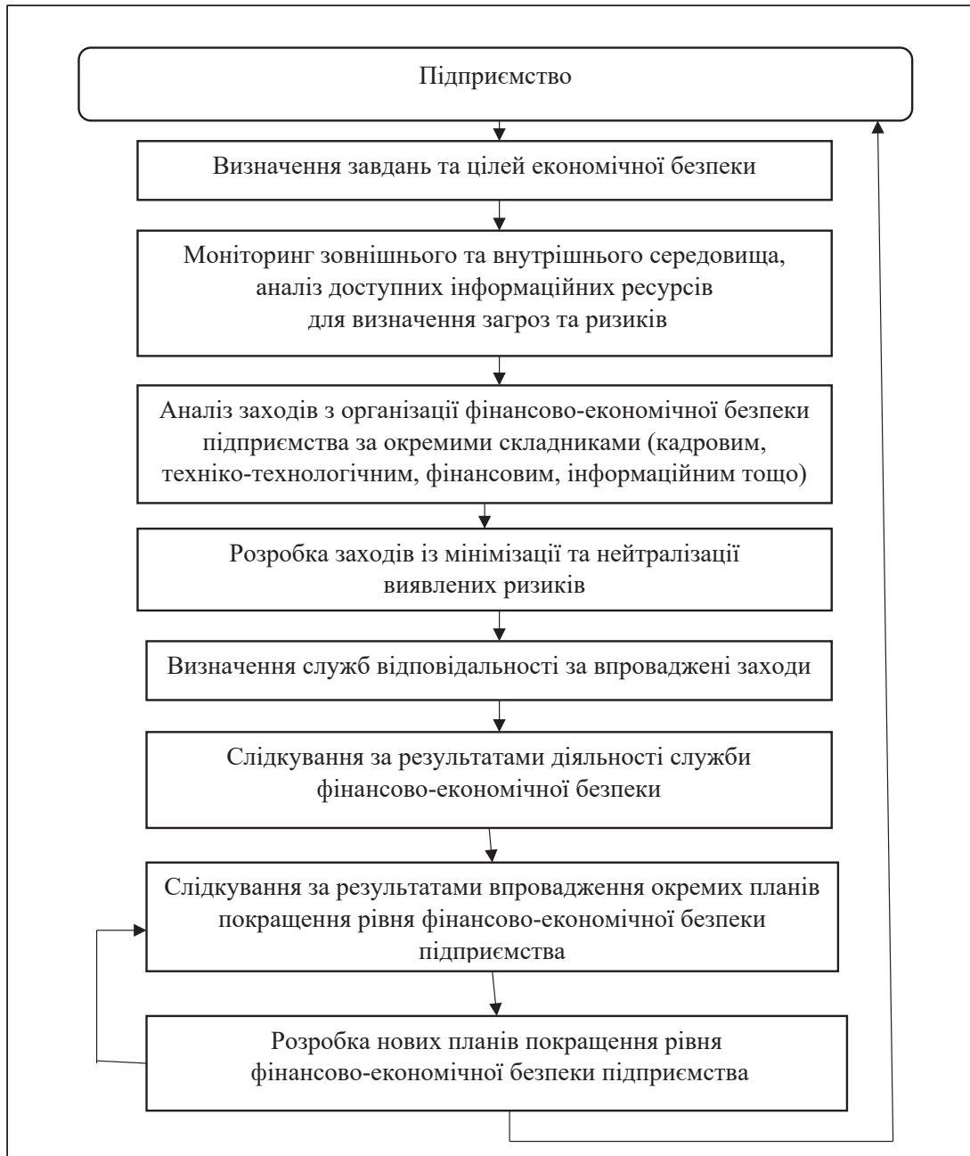
Рис. 2. Схема організації системи фінансово-економічної безпеки на підприємстві