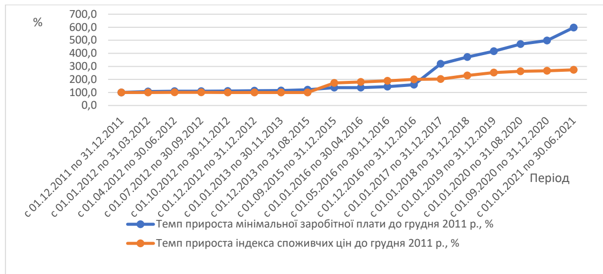
Рис. 3. Порівняння динаміки мінімальної заробітної плати з темпом приросту індексу споживчих цін попереднього періоду наростаючим підсумком до грудня 2011 р.

Таким чином зіставлення динаміки мінімальної заробітної плати доцільно проводити з темпом роста цін попереднього періоду (рис. 3) [9].