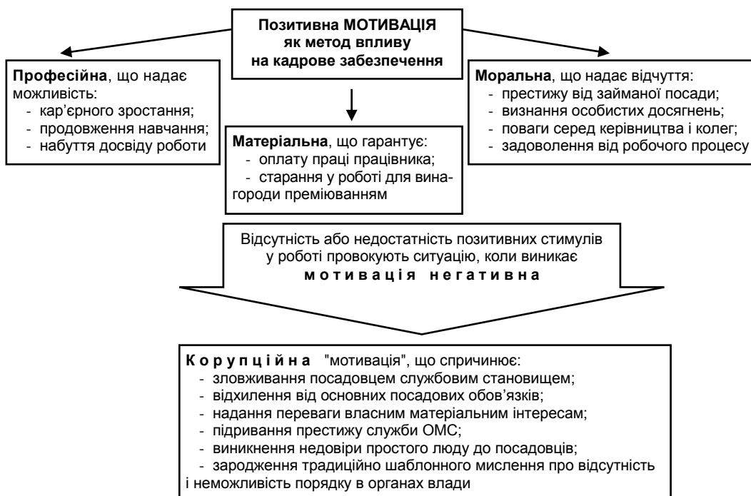
Рис. 2. Різноманітність мотиваційних ситуацій

Для вирішення проблем кадрового забезпечення ОМС проаналізовано мотиваційні ситуації (рис. 2), які може використовувати керівником установи, агітуючи активний і плідний робочий процес.