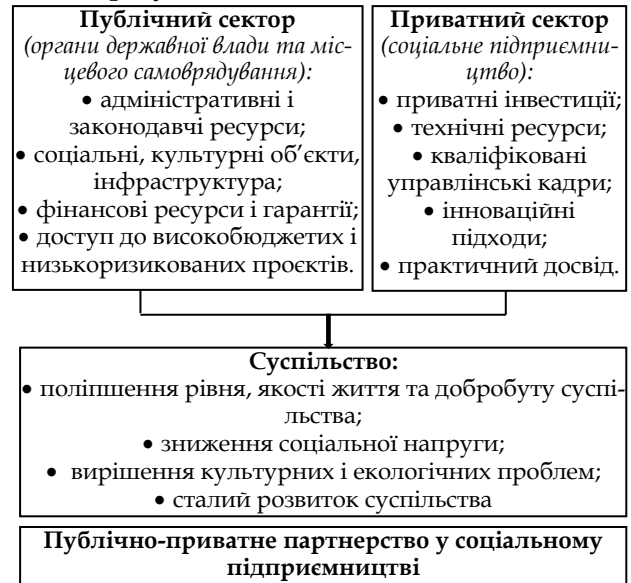
Рис. 1. Публічно-приватне партнерство у соціальному підприємстві

- підприємницький підхід, який передбачає використання у власній діяльності функції планування, аналізу, моніторингу, постійного контролю над своєю діяльністю з урахуванням економічних пріоритетів і соціальних результатів [4].