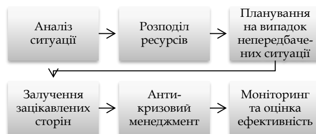
Рис. 2. Методи стратегічного управління в умовах воєнного стану

Виділяють 6 методів стратегічного управління в умовах воєнного стану (рис. 2).