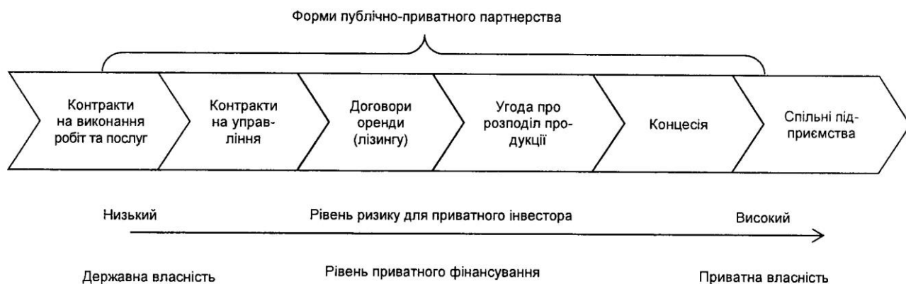
Рис. 1. Форми публічно-приватного партнерства

Фінансовий інструмент – це засіб, за допомогою якого фінансування / капітал передається від інвесторів до кінцевих споживачів капіталу. Залежно від того, хто і на яких умовах надає фінансування, проекти фінансуються за допомогою поєднання боргових (позики) і пайових (власності) інструментів. Також доцільно виділити квазікапітал (гібридні інструменти) – це такі фінансові інструменти, які мають певні характеристики як інструментів власності, так і інструментів позики (рис. 2). Деталізація фінансового інструментарію ППП свідчить про досить широкі та різноманітні можливості для використання потенціалу як дер-