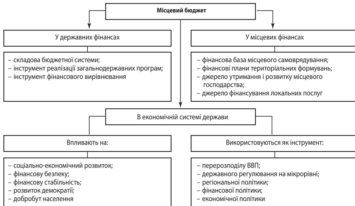
Рис. 2. Суспільна роль місцевих бюджетів