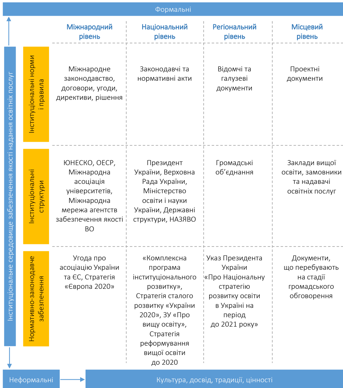
Рисунок 2. Інституціональні засади забезпечення якості вищої освіти