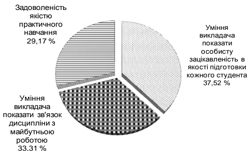
Рис. 2. Результати опитування студентів, які закінчили навчання

Результати дослідження серед студентів, які закінчили навчання за фахом "Туризм" подано на рис. 2.