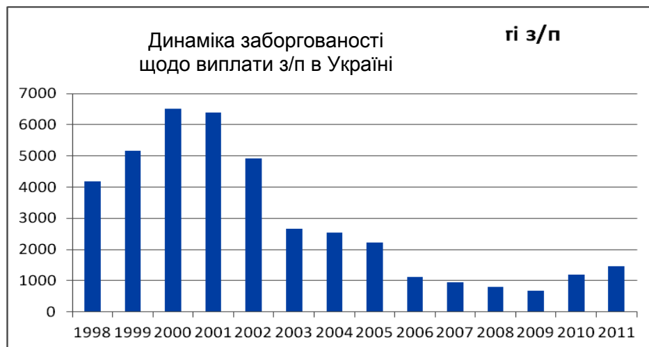
Рис. 2. Динаміка заборгованості щодо виплати заробітної плати в Україні

На рис. 2 наведені дані заборгованості щодо виплати заробітної плати України. Можна побачити, що до 2009 року спостерігалася тенденція до зниження заборгованості, проте вже у 2010 і 2011 роках заборгованість зростає, що пов'язано з важкою економічною ситуацією в Україні.