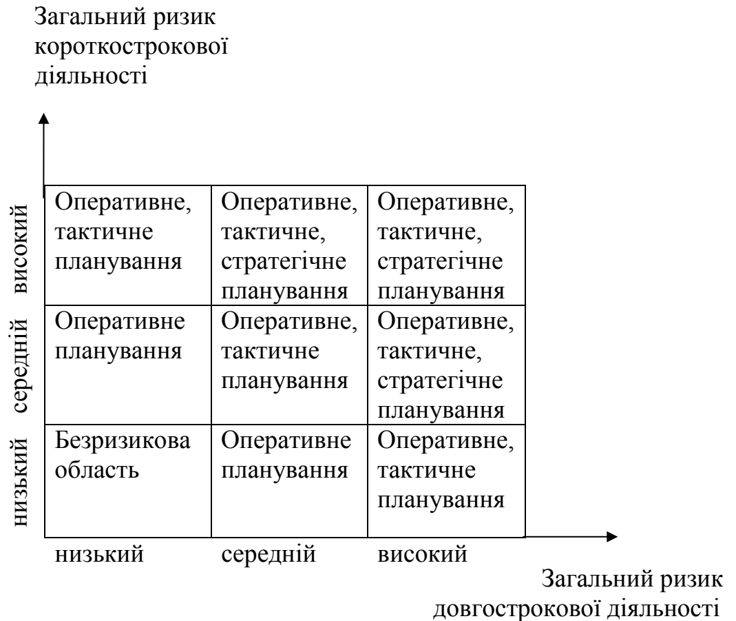
Рис. 3. Матриця співвідношення ризиків коротко – і довгострокової діяльності в розрізі оперативного, тактичного та стратегічного планування

Квадрант 2. У короткостроковій діяльності ризик відсутній, однак у довгостроковій перспективі спостерігається збільшення ризику, тому необхідно використовувати при плануванні тактики, спрямовані на пошук нових постачальників та якісної сировини.