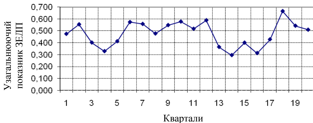
Рис. 1. Динаміка узагальнюючого показника ЗЕДП ДП «Харківський завод транспортного машинобудування ім. В.О. Малишева» за 2008–2012 рр.

Згідно з обґрунтованим методичним підходом здійснено комплексну оцінку ЗЕДП, яка доводить існування спільних проблем в управлінні зовнішньоекономічною діяльністю підприємств, що досліджувались. Зокрема, аналіз динаміки узагальнюючого показника зовнішньоекономічної діяльності ДП «Харківський завод транспортного машинобудування ім. В.О. Малишева» (рис. 1) довів існування тенденції неритмічного функціонування підприємства та низьку ефективність його ЗЕД.