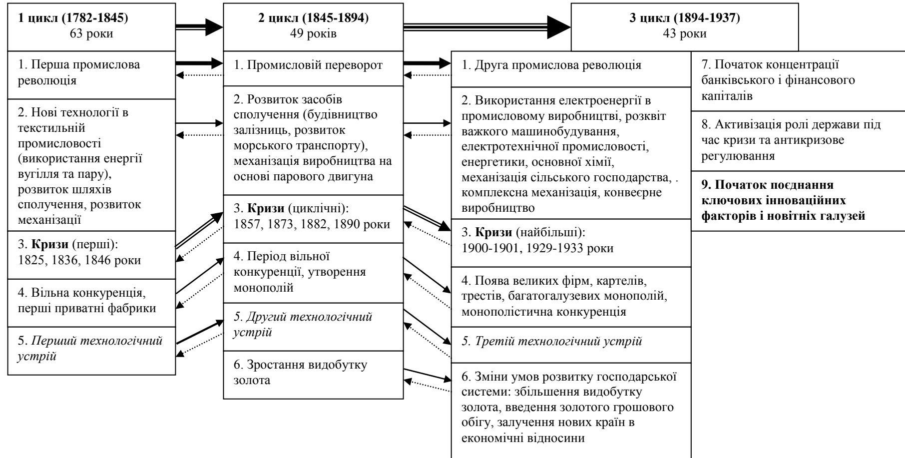
Рисунок 1 – Порівняльна характеристика особливостей першого, другого та третього циклів