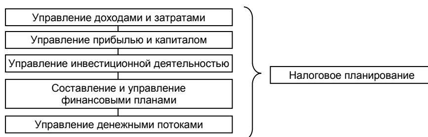
Рис. 1. Место налогового планирования в системе управления финансами хозяйствующих субъектов

Существует большое количество видов планирования. Наряду с такими видами планирования, как финансовое, социальное, бюджетное (в зависимости от отдельных видов ресурсов), правомерно выделять также налоговое планирование (рис. 1).