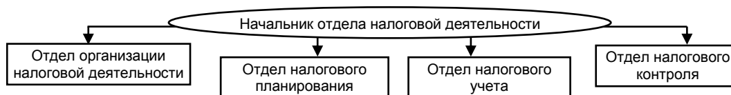
Рис. 3. Структура налоговой службы предприятия

На рис. 3 представлена примерная структура налоговой службы предприятия.