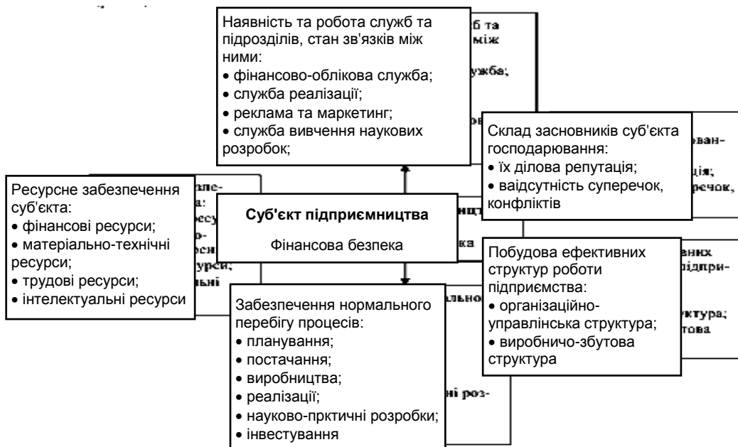
Рис. 3. Внутрішнє коло фінансової безпеки суб'єкта господарювання

Він поєднує освітньо-кваліфікаційні якості персоналу, його компетентність, склад засновників та наявність серед них протиріч, рівень вмотивованості персоналу, наявність та стан взаємозв'язків між структурними підрозділами суб'єкта, стан забезпечення підприємства всіма видами ресурсів тощо (рис. 3).