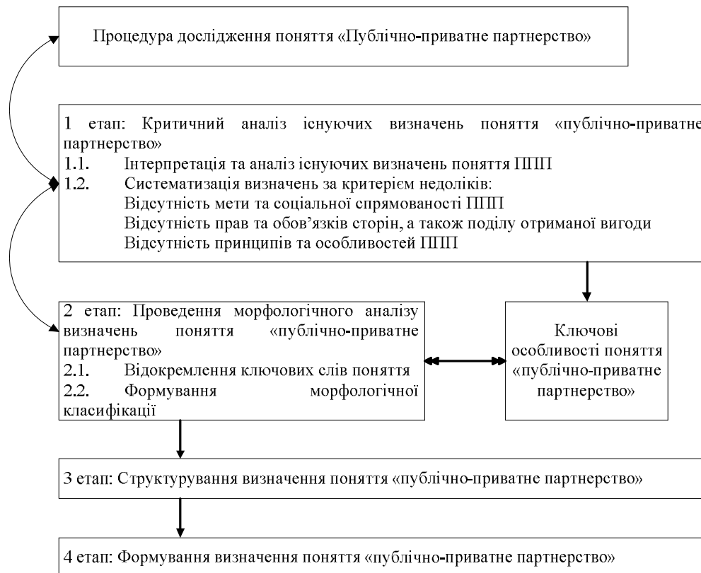
Рис. 2. Процедура формування визначення поняття «публічно-приватне партнерство» з використанням морфологічного аналізу

У світі сьогодні існує багато трактувань поняття ППП: від визначень Організації Об'єднаних Націй та Всесвітнього банку до науково-теоретичних визначень його окремими науковцями. Серед економістів й досі немає єдиної точки зору з приводу цього питання. В українській практиці сьогодні під одним поняттям «публічно-приватне партнерство» доволі часто розуміють зовсім різні явища, механізми, організаційні форми. Проте, загалом визнаного трактування поняття зараз не існує, як не існує і системного розуміння явища на державному рівні. З цього приводу, нами пропонується, насамперед, провести комплексне дослідження сутності визначення «публічно-приватне партнерство» та надати науково-обґрунтоване трактування цього поняття. Для цього запропоновано методичний підхід до визначення поняття «публічно-приватне партнерство». Процедура дослідження змістовного складу ППП за допомогою критеріїв морфологічного аналізу, наведено на рис. 2.