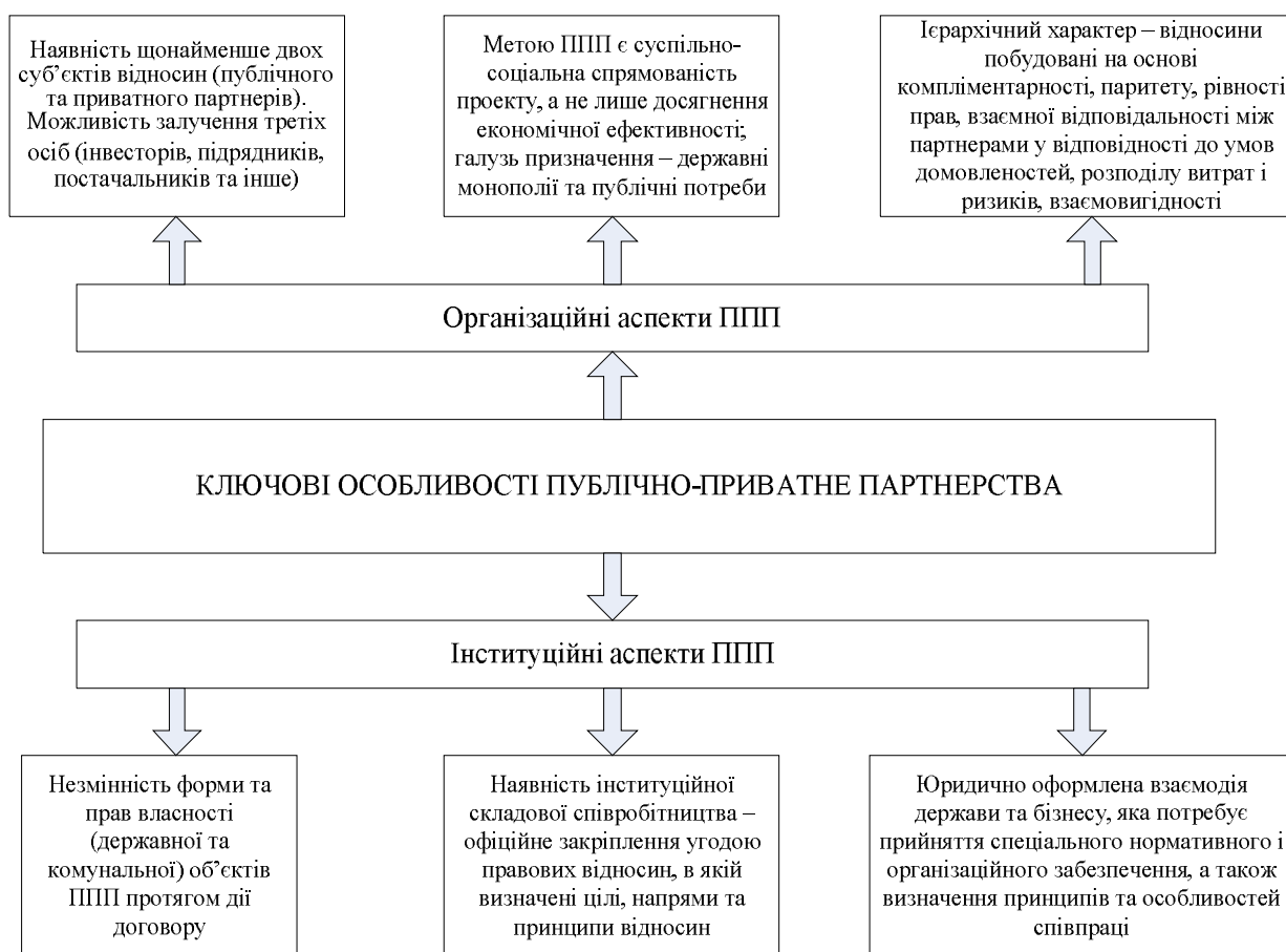
Рис. 3. Ключові особливості ППП (авторське бачення)

Такі характерні особливості, по-перше, дозволяють виділити ППП в особливу економічну категорію та відокремити даний механізм від інших форм взаємодії держави та бізнесу, а, по-друге, їх наявність є обов'язковою для кожного партнерського проекту (рис. 3). Це дає можливість конкретизувати визначення в межах особливостей ППП та його призначення.