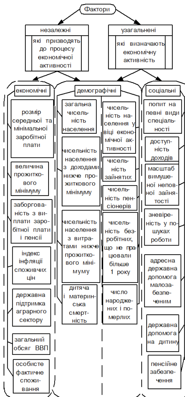
Рис. 2. Взаємозв'язок факторів економічної активності

Дане первинне угруповання вперше поєднує саме такі три складові: економічну, демографічну та соціальну політику. Таке угруповання слід розуміти як загальну категорію об'єднання елементів, що не є системою на даному етапі дослідження. Економічна активність визначає економічні можливості, які обумовлюють соціальний статус людини і демографічну поведінку населення. Така залежність призводить до необхідності врахування макроекономічних і соціальних показників при розв'язанні проблеми оцінки економічної активності населення.