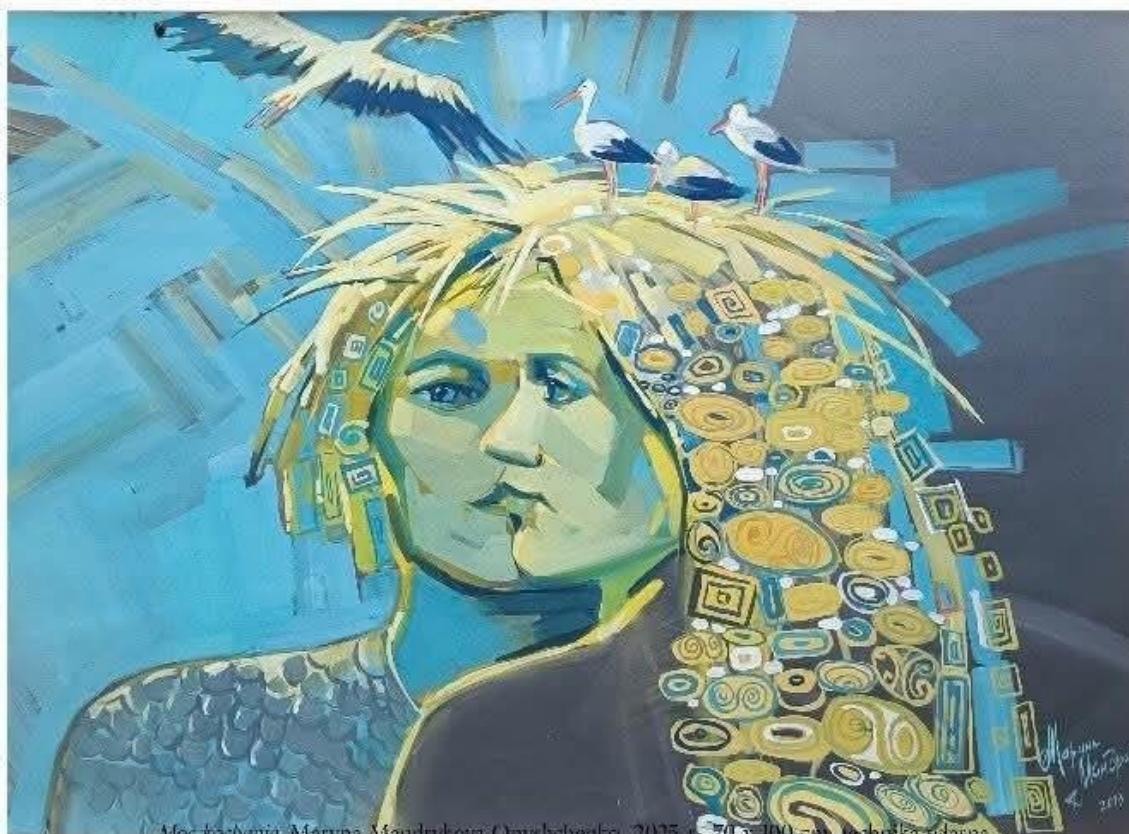
Moc kobinita, Maryna Mandrykova-Onyshchenko, 2025 r., 74 x 100 cm, technika własna