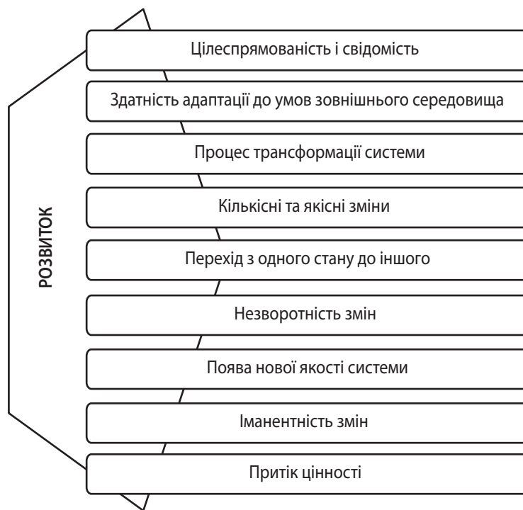
Рис. 2. Сутнісні характеристики категорії «розвиток підприємства» в сучасному полі наукових досліджень

кількісних і якісних змін, перехід системи від одного стану до іншого, незворотність трансформацій, формування нової якості системи, іманентність змін і забезпечення притоку цінності [25–27].