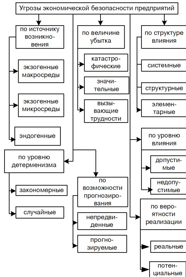
Рис.1. Классификация угроз ЭБПРТ

Анализ угроз целесообразно проводить в следующей последовательности: 1) анализ экзогенных угроз макроокружения как факторов воздействия на внутреннюю среду, внешнюю среду и экономическую безопасность предприятия; 2) анализ экзогенных угроз микроокружения как факторов воздействия на внутреннюю среду и экономическую безопасность предприятия; 3) анализ эндогенных угроз как факторов, влияющих на экономическую безопасность предприятия.