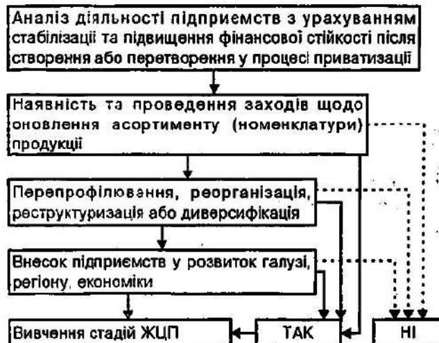
Рис. 2. Схема визначення стадій життєвого циклу підприємства

З урахуванням зазначеного вище пропонується механізм здійснення попереднього аналізу діяльності підприємства та визначення стадій ЖЦП (рис. 2).