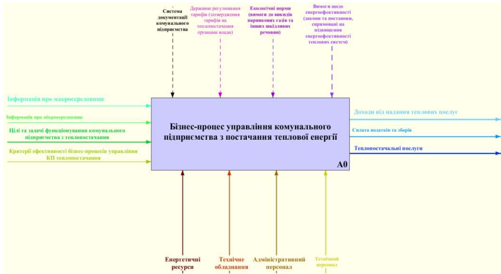
Рис. 1. Контекстна діаграма «Бізнес-процеси управління комунального підприємства з постачання теплової енергії»