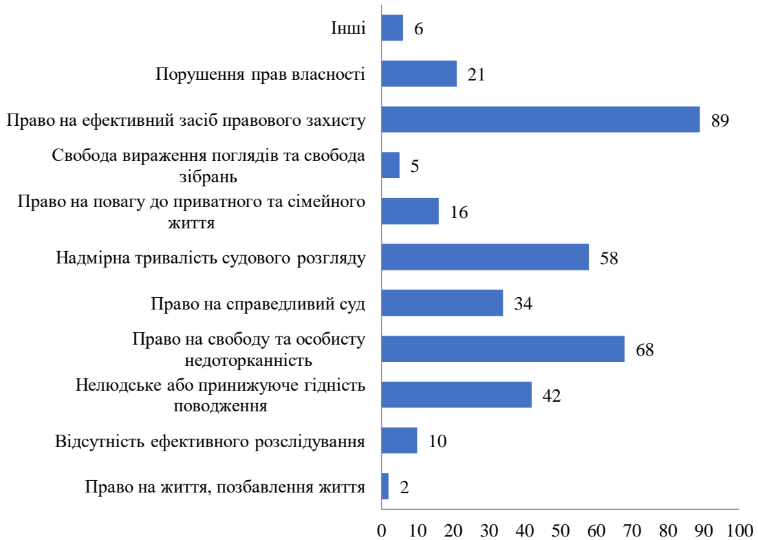
Рис. 2. Основні категорії порушень у справах проти України в Європейський суд з прав людини (сформовано авторами на підставі [11])

Найбільшу частку справ проти України в Європейський суд з прав людини становлять порушення права на справедливий суд, зокрема проблеми невиконання рішень національних судів та надмірної тривалості судового розгляду. Значною також залишається кількість справ, пов'язаних із неналежними умовами утримання під вартою, жорстоким поведінням та порушенням права на свободу та особисту недоторканність.